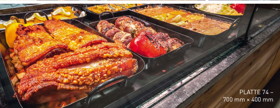
PLATTE 74 – 700 mm × 400 mm