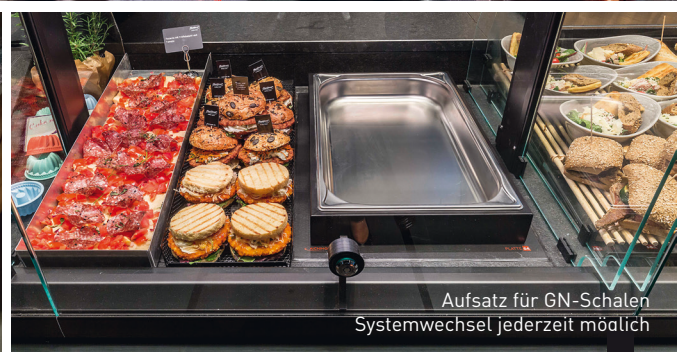
Aufsatz für GN-Schalen Systemwechsel jederzeit möglich