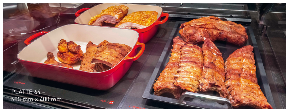
PLATTE 64 – 600 mm × 400 mm